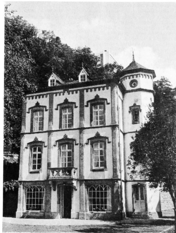
La maison natale de Robert Schuman, dans laquelle le grand Européen passa les vingt premières années de sa jeunesse, surplombe la ville basse de Luxembourg. Elle a été parfaitement restaurée par l'Etat luxembourgeois.